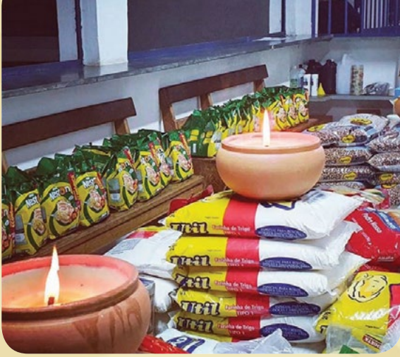
Campanha Ser Solidário na Quarentena .

nossas igrejas, a Arquidiocese apresentou um documento intitulado Ação missionária para um novo tempo . De imediato, pensamos tratar-se de um documento para a reabertura das nossas igrejas. Na verdade, trata-se de uma nova percepção da realidade e a proposta de uma reeducação em vista de continuar anunciando o Evangelho nas possibilidades do tempo presente. Ninguém arrisca um ‘quando’ para o fim da pandemia e ninguém aposta num retorno à situação anterior a ela. Logo, trata-se de viver a vida com os desafios da prática do amor.